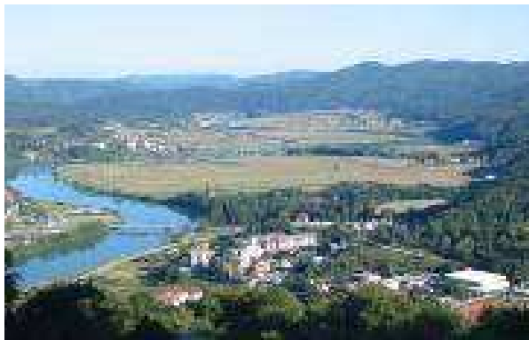
Radeče in Sava