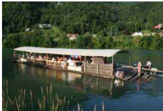
Splavarjenje po Savi