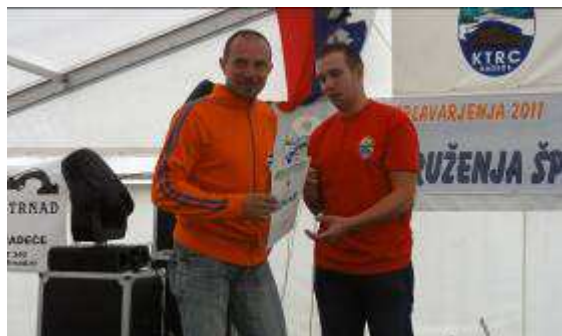
Priznanja za najboljše športnike