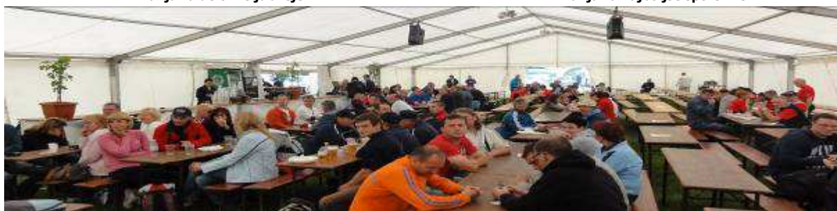
Družabno srečanje delavcev športnih centrov in zabava