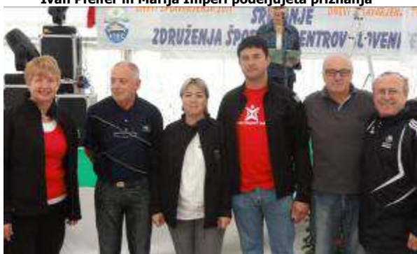
Priznanja za delovne jubileje