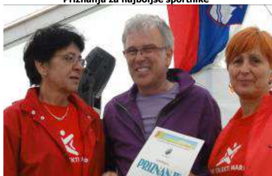
Priznanja za najboljše športnike